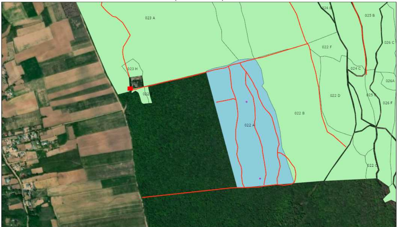
Schita parchetului p1581

Proprietar: INGKA INVESTMENTS FOREST ASSETS SRL