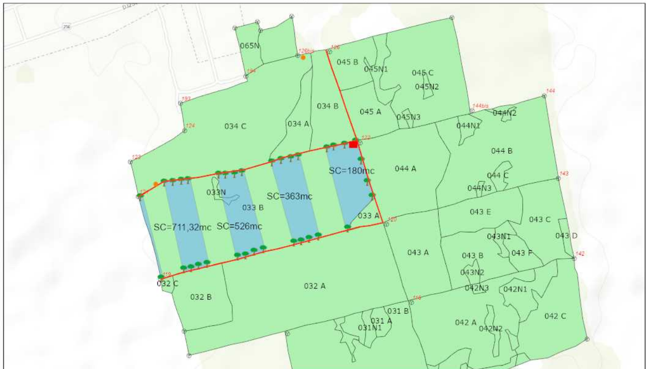
Schita partida 2114

Proprietar: INGKA INVESTMENTS FOREST ASSETS SRL