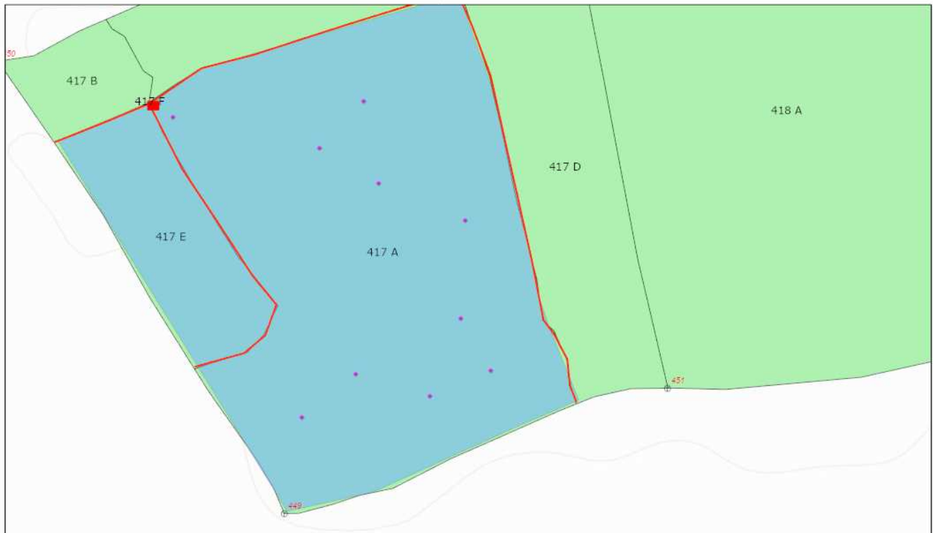
Schita partida 2164

Proprietar: INGKA INVESTMENTS FOREST ASSETS SRL