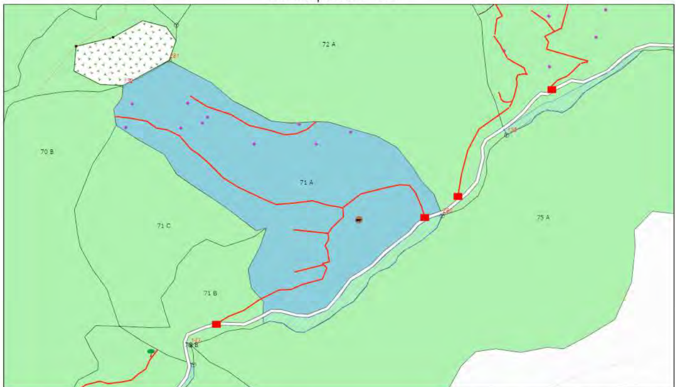
Schita partida 1174

Proprietar: INGKA INVESTMENTS FOREST ASSETS SRL